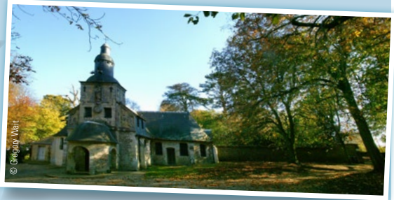
Panorama de la Côte de Grâce